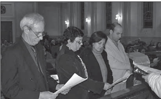
Consagración de nuevos Diáconos Nacionales