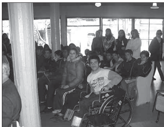
Otro aspecto del culto en IBV