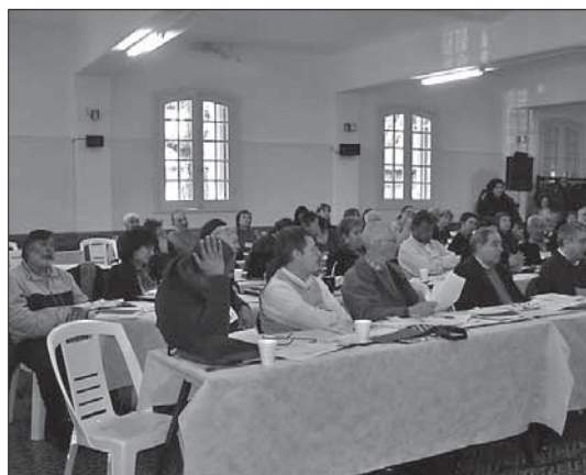
XXI Asamblea, vista parcial