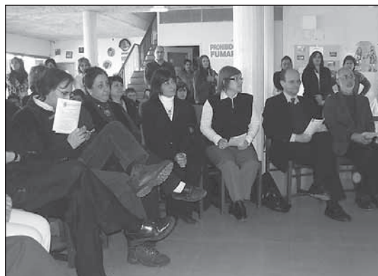
Culto por los 85 años del Instituto de Buena Voluntad