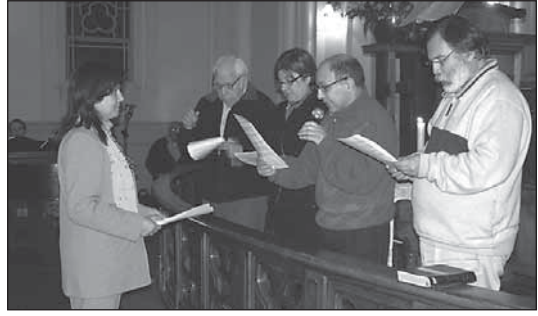
Consagración de nueva presbítera