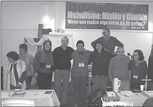
Junta de Vida y Misión anterior