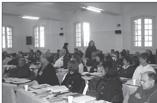
Otra vista de la Asamblea